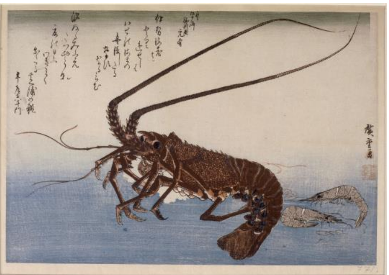
Utagawa Hiroshige c.1832