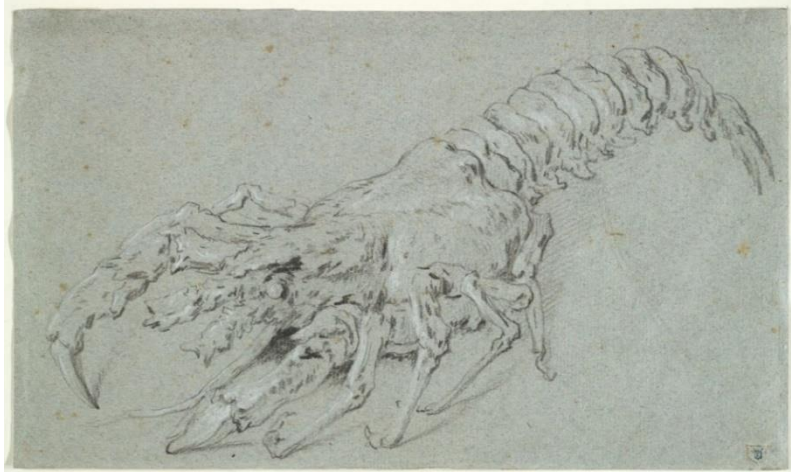
Jean-Baptiste Oudry, (1686–1755) : langouste épineuse