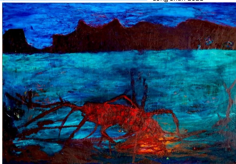
Louis-Paul Ordonneau 2022