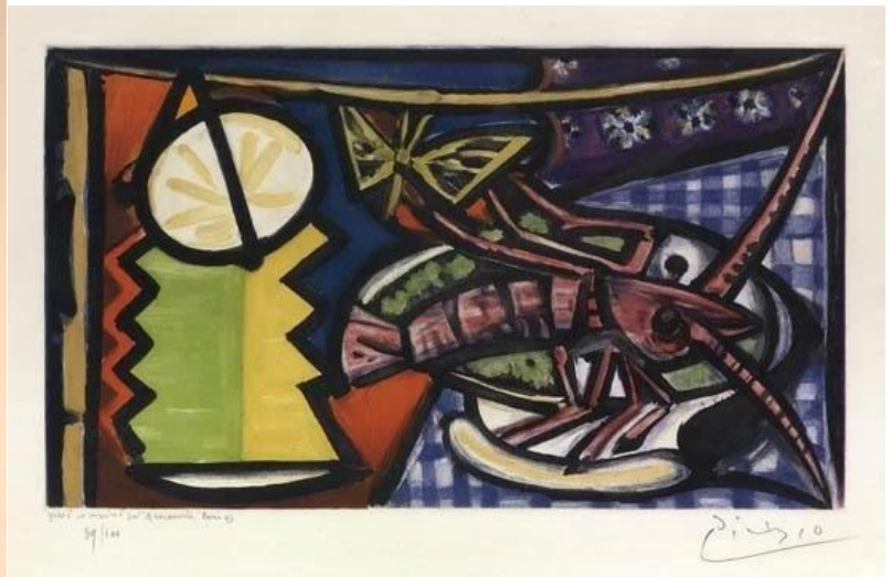
nature morte 1945