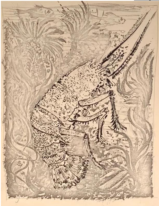
Pablo Picasso 1936