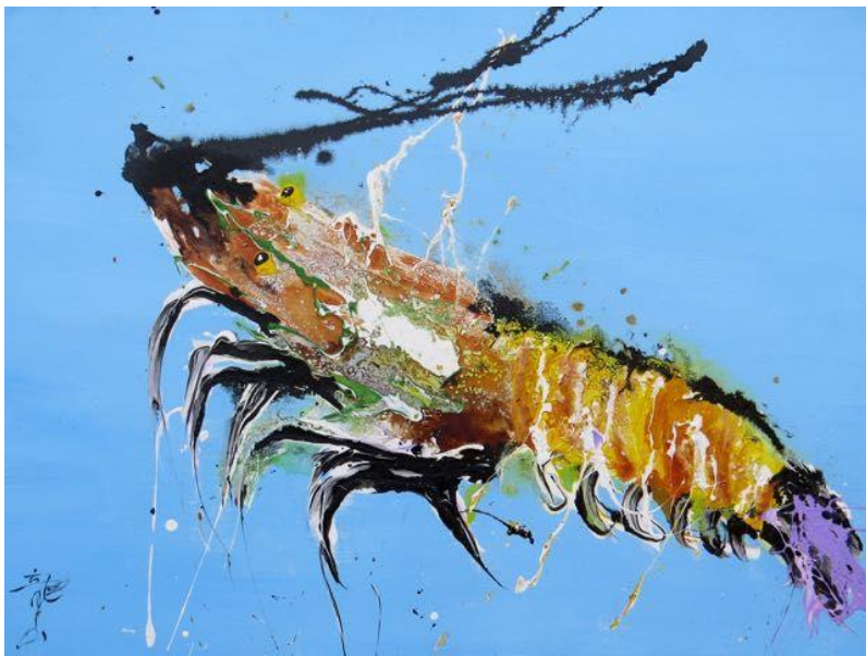
Long Shan 2021