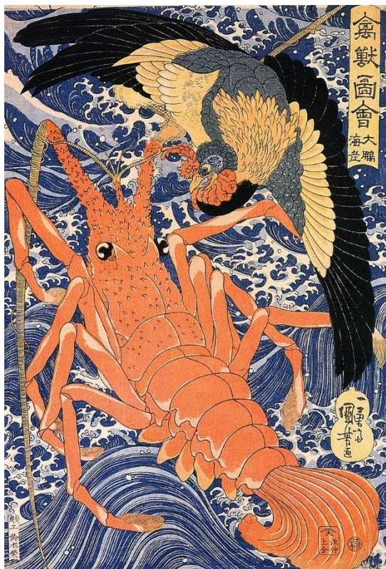
Utagawa Kuniyoshi ( 1798-1861)