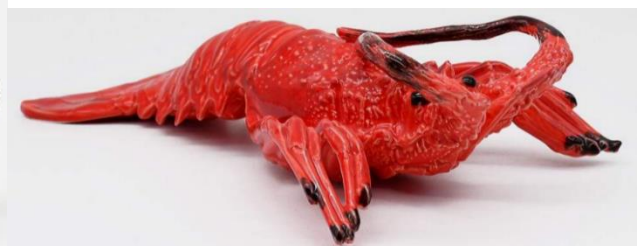
céramique de Caldas da Rainha, Portugal