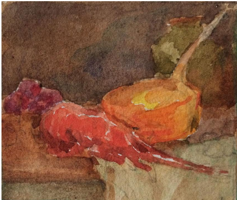
François Corbellini (1863–1943) : Etude de nature morte avec langouste et casserole