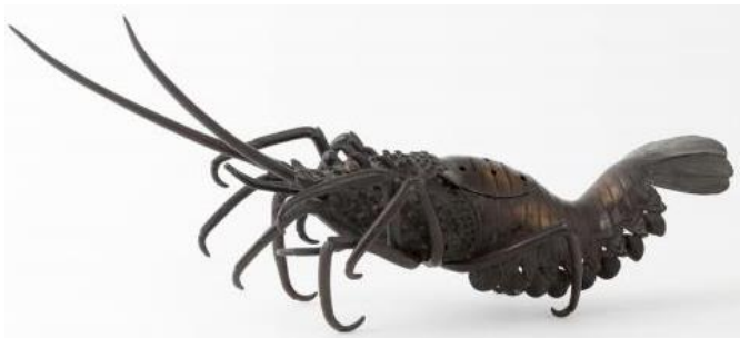
Brûle parfum bronze Japon